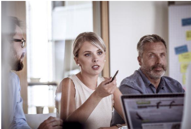
Flexibele werkmethoden vereisen nieuwe communicatietools

In de steeds meer gedigitaliseerde wereld zijn flexibele, veelzijdige werkmethoden, waaronder werken op mobiel of op afstand, de nieuwe norm. Volgens onderzoeksbureau Gallup werkt 43% van de Amerikaanse werknemers weleens op afstand. Ze werken deels of volledig op een andere locatie dan hun collega's 1 . Werken buiten kantoor is al langer gebruikelijk in sectoren zoals de bouw en retail. Maar nu biedt mobiele technologie bedrijven meer mogelijkheden om flexibel te werken – bijvoorbeeld als een stimulans op een concurrerende arbeidsmarkt. Daarmee is ook het karakter van de beroepsbevolking sterk veranderd: een tiende van het bedrijfspersoneel werkt nu drie of meer dagen vanuit huis 2 .